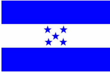
Liste de présidents depuis 1990

1990 - 1994 | Rafael Leonardo Callejas Romero 1994 - 1998 | Carlos Roberto Reina Idiáquez 1998 - 2002 | Carlos Roberto Flores Facussé 2002 - 2006 | Ricardo Maduro Joest 2006-2009 | José Manuel Zelaya 2009-2010 | Roberto Micheletti Baín ( de facto ) 2010 - 2013 | Porfirio Lobo Sosa 2013 - [2017] | Juan Orlando Hernández