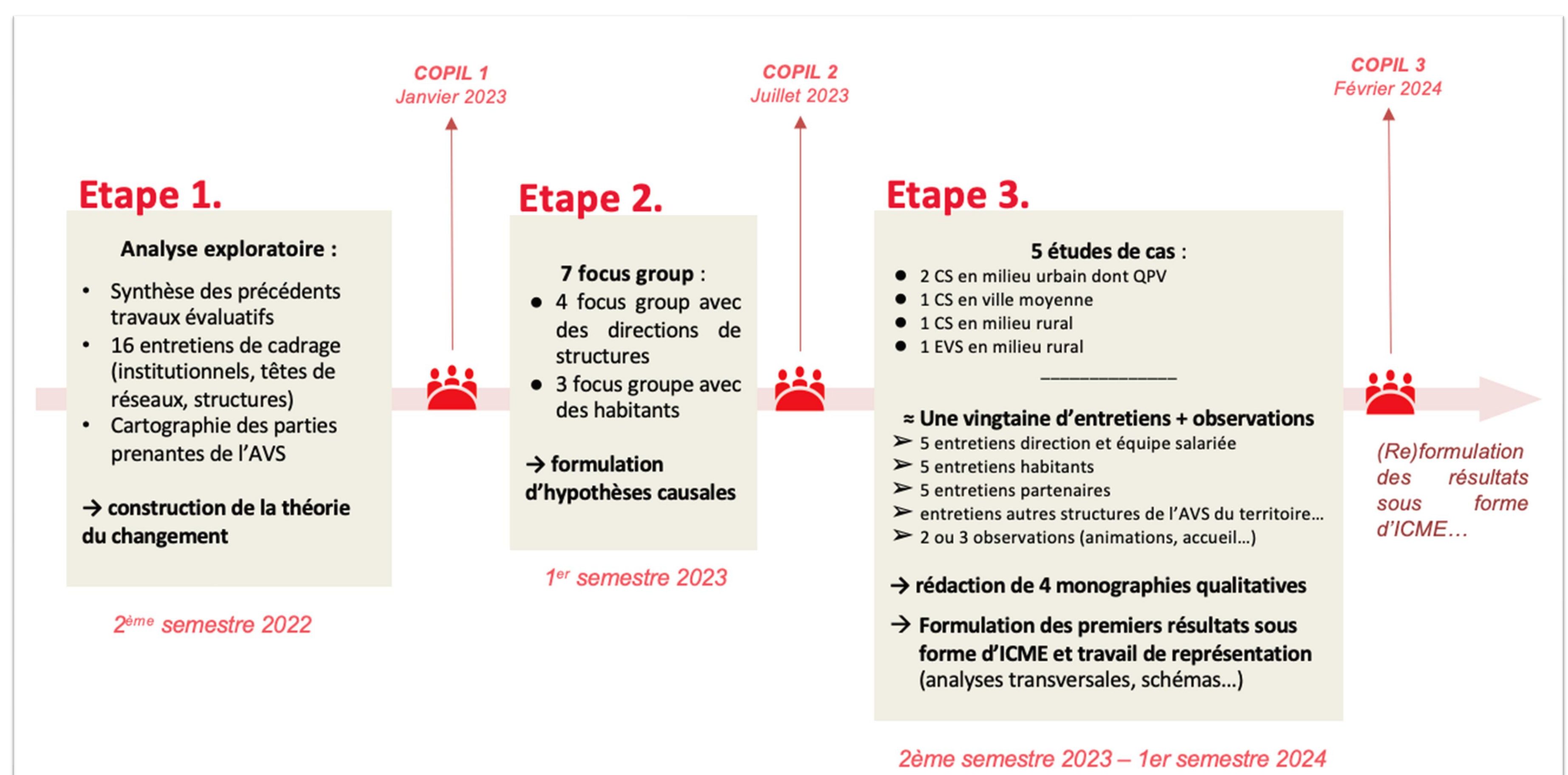
Encadré 1: Méthode de la recherche évaluative sur l'animation de la vie sociale

En parallèle, l'évaluation est complétée par un volet quantitatif qui s'appuie sur l'exploitation de la base Senacs (Système d'Echanges Nationaux des Centres Sociaux) portée par la Cnaf et la Fédération des centres sociaux et socioculturels de France. La base utilisée est celle du questionnaire 2022 (3215 structures répondantes) qui offre une vision d'ensemble des structures de l'AVS dans leur organisation fonctionnelle et leur couverture territoriale.